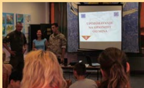
Pripadnici EUFOR-a i lokalna instruktorka tokom predavanja

Iako se pripadnici EUFOR-a i Oružanih snaga BiH trude da riješe problem, mine će još dugo vremena predstavljati veliku prijetnju u Bosni i Hercegovini. EUFOR podržava OS BiH kroz proces izvođenja obuke iz oblasti deminiranja, čiji timovi uklanjaju i uništavaju eksplozivne naprave širom zemlje.