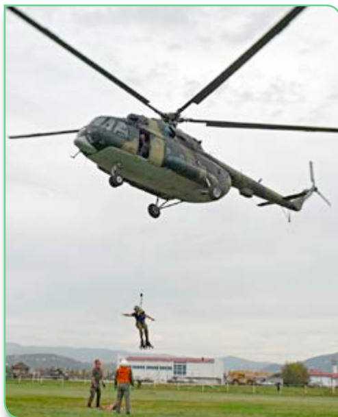
Pristup minskom polju iz zraka