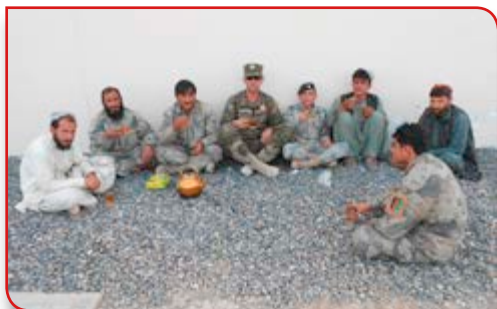
Moralna odgovornost prema svijetu

Zahvaljujući Centru za mirovne operacije sa sjedištem u Butmiru, učešće vojnika OS BiH u nekim budućim misijama je sigurno. Ovaj centar, kolociran sa snagama EUFOR-a, omogućava kandidatima da steknu određene vještine i znanja koja će im pomoći u obavljanju zadataka. Osim kreiranja opće stabilnosti u državi i okruženju, svaka vojska treba da radi na izgradnji mira u područjima koja to trebaju. Njihov zadatak je da pružaju pomoć u prirodnim katastrofama, da planiraju, obučavaju i šalju vojsku u mirovne operacije. BiH je dugo koristila iste usluge i vrijeme je da se i OS uključe još više u taj proces. To je moralna odgovornost prema svijetu i nacijama koje su pomagale Bosnu i Hercegovinu.