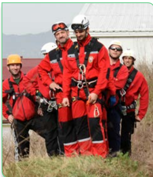
GSS iz Zenice i Mostara

Komandant EUFOR-a je, također, potcrtao da se drugi segment obuke tiče civilno-vojne saradnje (CIMIC) koja je u funkciji opće dobrobiti, a kao primjer za to naveo je uspješno djelovanje tokom poplava koje su u maju pogodile BiH.