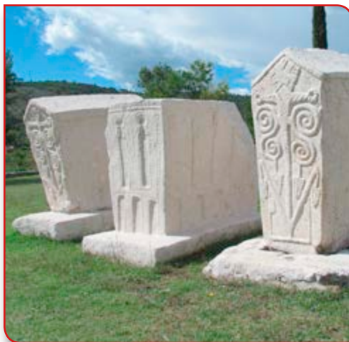
Kulturni fenomen BiH

U Stocu, na putu od Mostara prema Trebinju, u mjestu poznatom kao Radimlja, postoji ogromna nekropola, koja se pripisuje kultu Bogumila. Ovi nadgrobnici