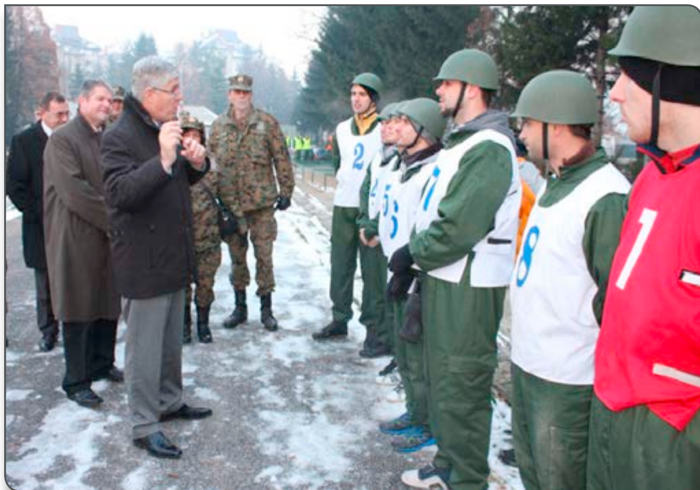
Ministar Zekerijah Osmić sa mladim kadetima

Među brojnim kandidatima, bilo je samo osam odabranih djevojaka. Bilo im je teško, jer su bile jednake sa mladićima, stoga je za većinu njih ovo bila teška borba. "Ovo je veliko iskustvo za svaku djevojku. Bilo je teže nego što sam očekivala, ali sam zadovoljna svojim učinkom, posebno što sam mogla da se uvjerim koliko sam zaista jaka. Nismo imali povlašteni tretman i to je bila dodatna motivacija za nas. Smatram sebe vrlo privilegovanom što sam se našla među svim ovim kandidatima", kaže jedna od djevojaka koja je uspjela doći do završne faze obuke.