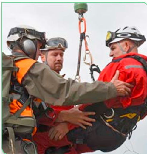
Značajna uloga timova gorske službe spašavanja tokom prirodnih nepogoda

„Cilj ove informativne kampanje jeste da se široj javnosti u BiH predstave naši naponi koje ulažemo na planu osposobljavanja i obuke u OSBiH. Svrha kampanje osposobljavanja i obuke, koja danas počinje, je da se promovira odličan posao koji obavljaju EUFOR i OS BiH, da se pokaže da se oni obučavaju u skladu sa međunarodnim standardima i da su sa svakim danom sve sposobniji“, istaknuo je general-major Heidecker.