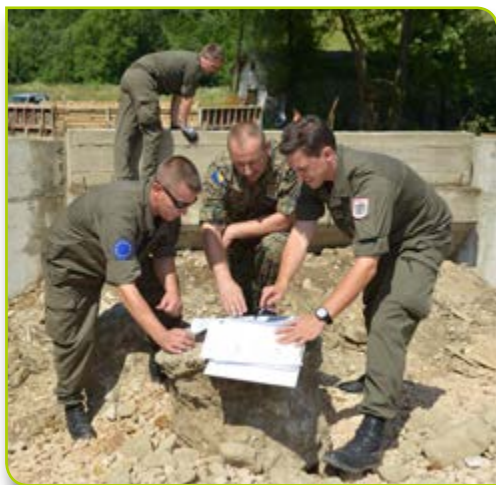
Inžinjeri OS BiH i EUFOR-a razmatraju plan izgradnje mosta u Dokanju

Brigadir Aplak: Sve počinje sa utvrđivanjem potreba same obuke. A, to se radi zajednički, sa pripadnicima OS BiH. Nakon što se identificira pitanje koje vještine su im neophodne, utvrđujemo vremenski period i sredstva koja su nam potrebna za izvršavanje obuke.