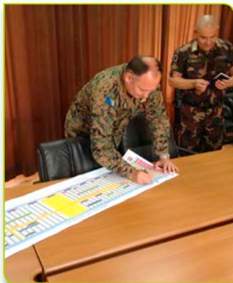
general-major Mirko Tepšić, brigadni general András Szűcs potpisuju Kalendar za 2015.

Prva verzija Kalendara programa izgradnje kapaciteta i obuke za 2015., a koji se odnosi na program izgradnje kapaciteta i obuku, potpisana je nedavno između general-bojnika Mirka Tepšića, zamjenika načelnika Zajedničkog stožera OS BiH za operacije i brigadnog generala András Szűcsa, načelnika stožera EUFOR-a. Potpisivanje kalendara je važna prekretnica u razvoju Oružanih snaga BiH. Kalendar za provedbu pomenutog programa za 2015., kreiran je u suradnji sa Oružanim snagama BiH, a sam proces njegovog kreiranja započeo je još u studenom 2013., na konferenciji za procjenu, gdje su ocijenjene i prethodne aktivnosti ovoga programa. Uslijedio je i Sporazum o mapi puta, u ožujku 2014., koji je sadržavao dogovor o tome kakvu vrstu potpore EUFOR može pružiti u 2015. godini. Razrađen je detaljan plan aktivnosti za svaku oblast i inkorporiran u Kalendar programa izgradnje kapaciteta i obuke za predstojeću 2015. godinu. Konačna verzija bit će potpisana u prosincu 2015.