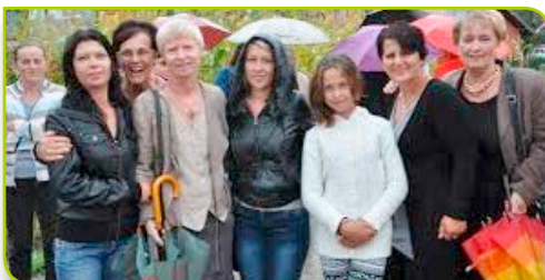
Anne Havnør prisustvovala je otvaranju dva rekonstruirana mosta u općini Tuzla

Razvojni program Ujedinjenih nacija (UNDP) izvršio je nabavku potrebitih materijala, koju je financirala Norveška, koja daje potporu normalizaciji života u ovoj općini. Predstavnica Veleposlanstva Norveške, inače zamjenica šefa misije Anne Havnør, također je prisustvovala ceremoniji otvaranja mostova u Solini i Brđanima. Ona je istakla doprinos Norveške tijekom poplava, kako u hitnim slučajevima, tako i u azi