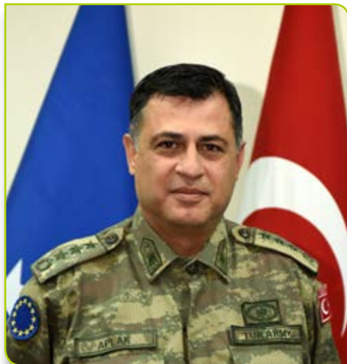
Pukovnik Hakan Aplak, zamjenik načelnika štaba EUFOR-a

Međunarodne krize u našem globaliziranom svijetu trebaju međunarodnu reakciju. A jedna država ne bi bila u stanju sama da se suprotstavi krizi sa izraženom internacionalnom dimenzijom. Stoga, oružane snage moraju međusobno saradivati, a da bi se to postiglo, potrebna je edukacija. Taj proces obično počinje sa jednostavnim stvarima, kao što je komunikacija (poznavanje jezika), a završava s kompleksnim procedurama koje se moraju proći, kako bi se zadaci uspješno izvršili. Jednostavnim riječima, što su metode izvršavanja zadataka sličnije, zajednički rad je efikasniji. Mi to zovemo “interoperabilne sposobnosti”.