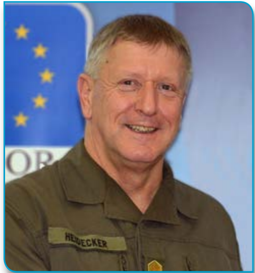
general-major Dieter Heidecker

Početak jeseni je, sigurno, i od velikog značaja za sve građane Bosne i Hercegovine, zbog održavanja izbora i formiranja vlade što predstavlja novu priliku za pozitivne promjene. Smatram da je u svakom demokratskom društvu, pa tako i u vašem, svaki pojedinac dužan ispuniti svoju građansku dužnost i iskoristiti mogućnost da učestvuje u kreiranju