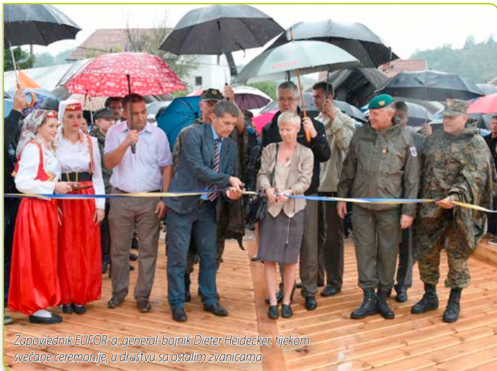
Zapovjednik EUFOR-a, general-bojnik Dieter Heidecker, tijekom svečane ceremonije, u društvu sa ostalim zvanicama

oporavka. Gospođa Havnør je posebno napomenula da su veliki doprinos tome dale UN i UNDP u BiH, i dodala da će se potpora Norveške lokalnim zajednicama nastaviti. UNDP vodi program za sanaciju šteta od poplava "Danas za nas", koji se bavi potrebama zajednica neposredno nakon poplava, uključujući rekonstrukciju osnovne infrastrukture u zajednici.