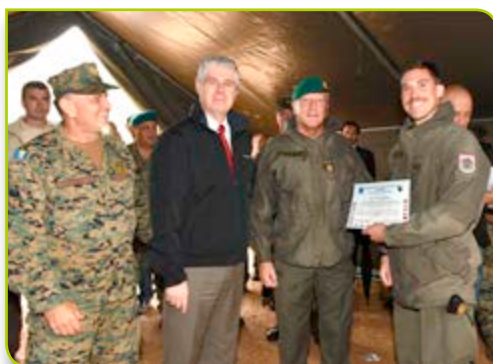
General-bojnik Anto Jeleč, ministar obrane Zekerijah Osmić, zapovjednik EUFOR-a general-bojnik Dieter Heidecker, predaju certifikat zahvalnosti poručniku Fuchsu, pripadniku EUFOR-ovog mobilnog inženjerskog tima iz Austrije

"Današnje otvaranje mostova je rezultat našeg zajedničkog rada, započetog tijekom operacije pružanja pomoći na saniranju šteta od poplava "Zajednički napor", kada smo počeli sa aktivnostima planiranja i obuke za ovaj posao. Sretan sam što danas vidim rezultate našeg zalaganja. Bio je ovo kombinirani rad Austrijskog mobilnog tima za obuku, osoblja EUFOR-a i OS BiH, Ministarstva, načelnika Zajedničkog stožera i pripadnika inženjerskih postrojbi. Ovo bi trebala biti početna točka za buduće zajedničke zadatke, u duhu dvostruke uporabe