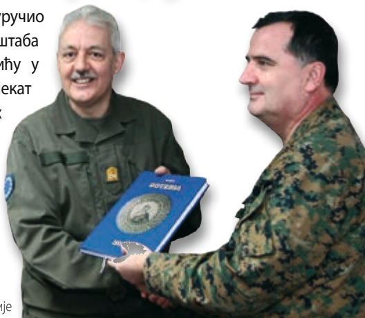
Командант ЕУФОР-а уручио документе о анализи стања муниције